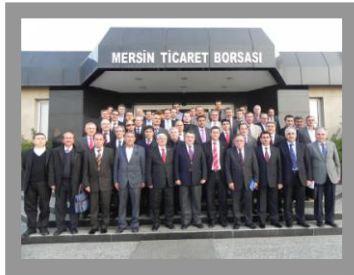
Ulusal Baklagil Konsey Toplantısı