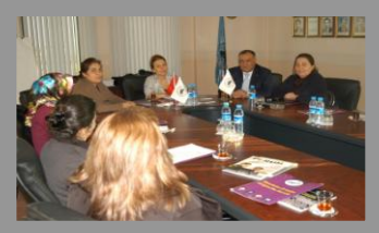
Kadın Girişimciler Kurul Toplantısı

13.10.2011 tarihinde TOBB İl Kadın Girişimciler Kurulu ve Frankfurt “School Of Finance management” banka kademe işbirliğinde girişimciliğe aday kadınlara “Girişimci Olmak İstiyorum” adı altında eğitim semineri verildi.