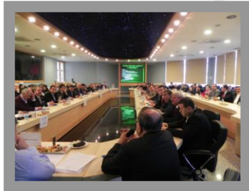
Ulusal Hububat Konsey Toplantısı