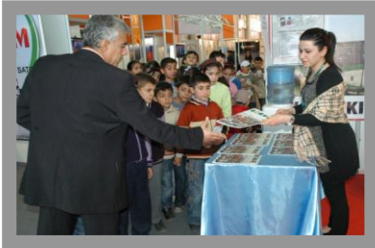
Tarım ve Hayvancılık Fuarı