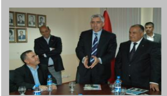
Ak Parti Milletvekillerinin Borsamızı Ziyareti