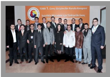
Genç Girişimciler Kurulu

TOBB Genel Kurula da Kurul olarak katılım sağlanmış ve ÇTONN yeni düzenlemelerinden “İCRA KOMİTESİ” esaslarına göre hazırlık çalışmalar başlanmıştır