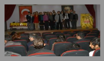
Girişimci Olmak İstiyorum Eğitim Semineri

İlimiz Kadın Girişimciler Kurulu 2011 Yılı içerisinde 5 Yönetim Toplantısı gerçekleştirmiş olup, Yapılan Yönetim Kurulu Toplantılarında toplam 7 gündem maddesi görüşülerek karar bağlanmıştır. Borsamızın Sekreteryasını yürüttüğü Kadın Girişimciler kurulu üye sayısı 39 olup 2011 yılı faaliyetlerine kısaca değinecek olursak